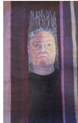
Hair and Skin