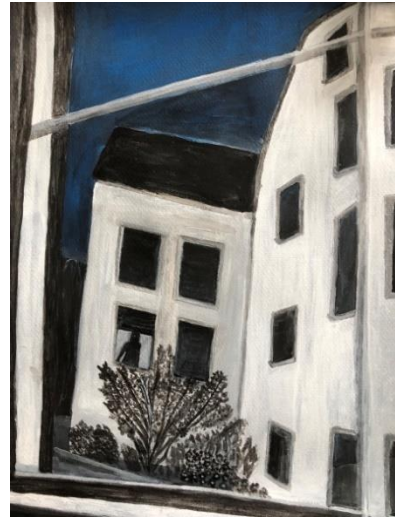
Outside My Window