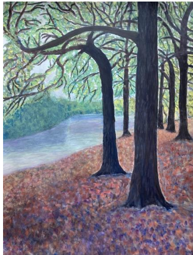
London: Queensmere Pond