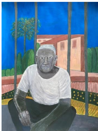
Mougins: Picasso's Grey T-Shirt