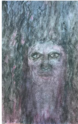
My Mistress' Eyes