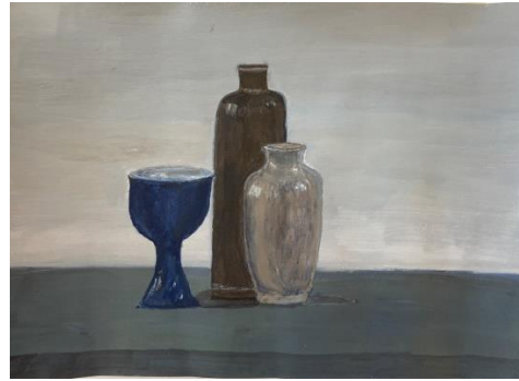
Morandi Still Life