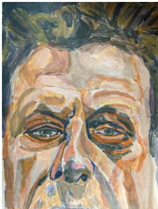
Lucian Freud's Black Eye