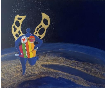
Off To See The World

Ich bin in London geboren und aufgewachsen, und wohne in der Schweiz seit über 30 Jahren. Ich male und zeichne seit ungefähr 20 Jahren, meistens mit Acryl, manchmal auch Aquarell. Oel und Gouache. Ich habe verschiedene Kurse gemacht und werde bald das dritte Jahr (Masterclass) im Malstudium an der SKDZ in Zürich beginnen. Hier einige Bilder: