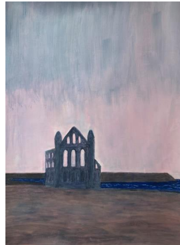
North Yorkshire: Whitby Abbey