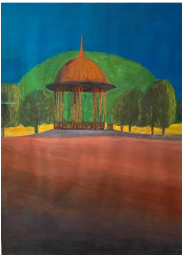
London: Clapham Bandstand