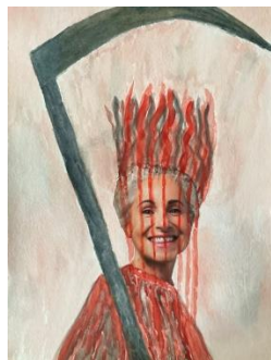
Rattle My Scythe