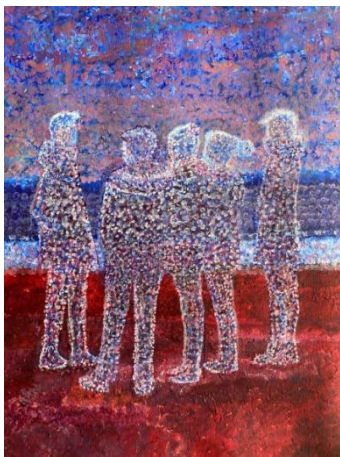
Brighton Beach December 2019