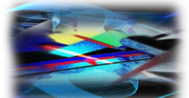
3 verschiedene Kompositionen/Beispiele aus der Serie resp. zum Thema „Picture Recycling“