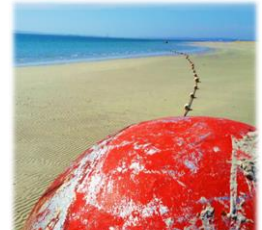
4 verschiedene Bilder/Beispiele zum Thema „Open your eyes“