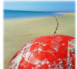
4 verschiedene Bilder/Beispiele zum Thema „Open your eyes“