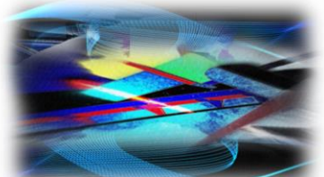
3 verschiedene Kompositionen/Beispiele aus der Serie resp. zum Thema „Picture Recycling“